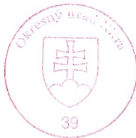
Ing. Mária Šumichrastová vedúca odboru

Osvedčenie o živnostenskom oprávnení vydané na základe § 66b ods. 1 a podľa § 47 ods. 1 v spojení s § 47 ods. 4 v súlade s § 10 ods. 1 zákona č. 455/1991 Zb. o živnostenskom podnikaní (živnostenský zákon) v znení neskorších predpisov.