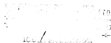
Komisionár (LE CHEQUE DEJEUNER s.r.o.)