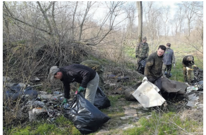
Vadászbrigád a természetben - Brigáda poľovníkov