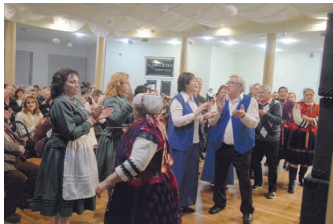
Farsang Zoboralján 2018 - Fašiangy na Podzoborí 2018