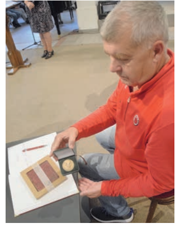
Véradás századszor - Darovanie krvi 100krát