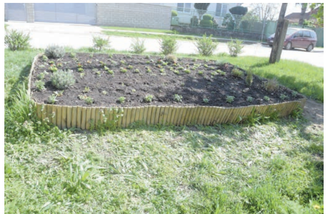
Tavaszi virágültetés - Jarná výsadba kvetín