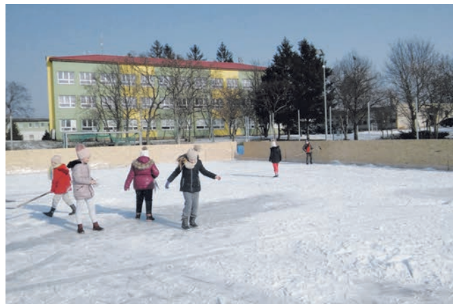
Jégpálya - Ľadová plocha