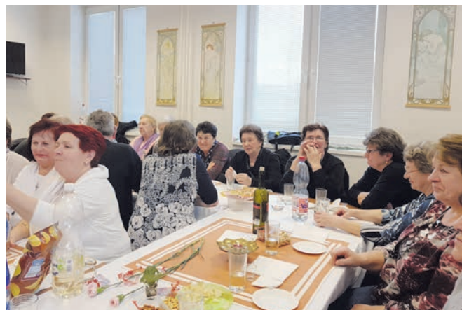
A nyugdíjasklub nőnapi találkozója - Oslava MDŽ v klube dôchodcov